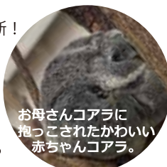
お母さんコアラに 抱っこされたかわいい 赤ちゃんコアラ。

義父に会いに、家族で鹿児島にいきました！ 広島から車で一気に九州横断！ 約8時間ほどで到着。鹿児島のシンボルである桜島を眺めながら、町を観光しました。2月でも上着が必要ないくらい暖かったです。人生2回目の訪問ですが、南九州市にある『知覧特攻平和会館』にも足を運びました。館内に展示されている資料や遺書を前にすると、自然と言葉が少なくなります。子どもができた今、前回とはまた違う重み、平和の尊さ、そして今を生きていることのありがたさを改めて考えさせられる、忘れられない時間となりました。